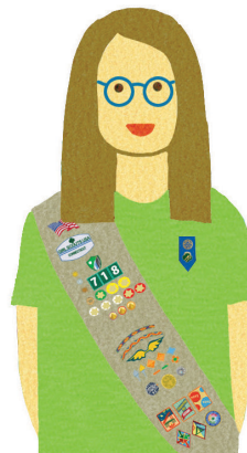
Seniors Grades 9-10