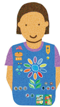
Daisies Grades K-1

Una Juliette o Girl Scout miembro individual, tiene la misma experiencia que las Girl Scouts que son parte de una tropa. Si usted es una familia Juliette, conéctese con su concilio para recibir apoyo y estar al día de los emocionantes eventos para toda la familia.