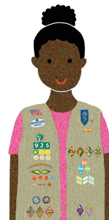
Cadettes Grades 6-8