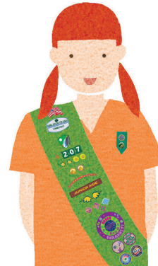
Juniors Grades 4-5