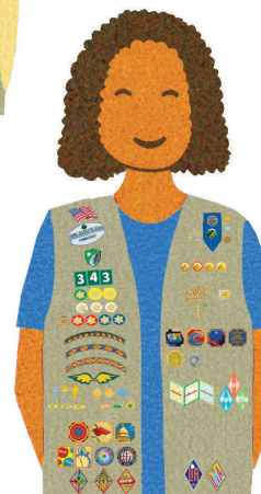
Ambassadors Grades 11-12