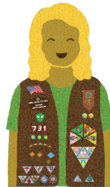
Brownies Grades 2-3